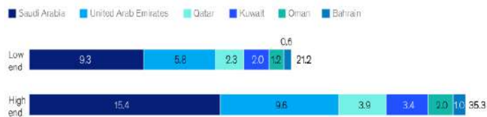
Potential annual value-added impact from generative AI, by Gulf Cooperation Council country, 1 $ billion

1 Based on 53 use cases.