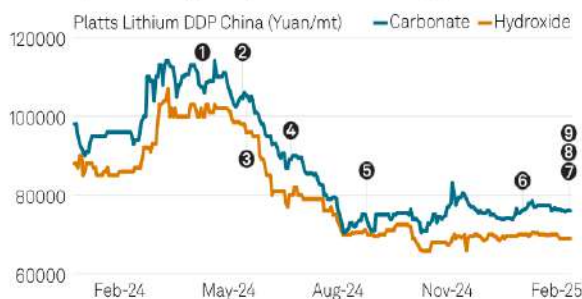
Lithium prices stagnate, increased bidding events observed

- بازار جهانی لیتیوم در هفته منتهی به ۲۱ فوریه شاهد افزایش فعالیت‌های مزایده‌ای، به‌ویژه در چین، پس از یک دوره رکود تقاضا در سه‌ماهه چهارم ۲۰۲۴ و اوایل ۲۰۲۵ بود. بر اساس داده‌های پلتس، قیمت کربنات لیتیوم با گرید باتری در سه‌ماهه چهارم در بازه ۷۰,۰۰۰ تا ۸۵,۰۰۰ یوان در هر تن متغیر بود. این روند در سال ۲۰۲۵ نیز ادامه یافت، هرچند پس از تعطیلات سال نوی قمری، رویدادهای مزایده‌ای افزایش یافته‌اند.